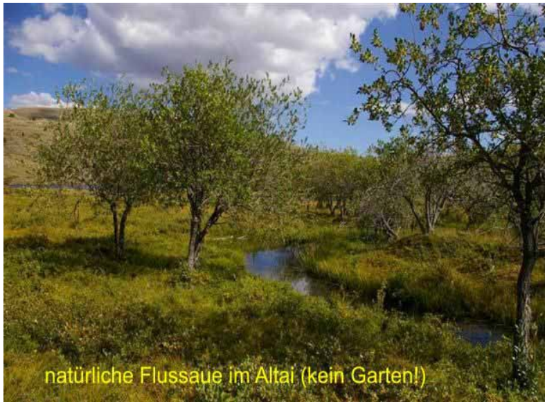
natürliche Flussaue im Altai (kein Garten!)

Die Organisation entspricht Gepflogenheiten an deutschen Hochschulen. Durchgeführt werden die Sommerschulen mit mehreren Bussen und LKW als autarke Expedition. Die Unterkunft erfolgt in Zelten (eigene Campingausrüstung ist notwendig). Die einzelnen Objekte stehen in direkter Nähe der Lagerplätze oder werden durch kleine, leichte Wanderungen ohne Gepäck erschlossen.