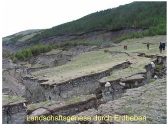
Landschaftsgenese durch Erdbeben